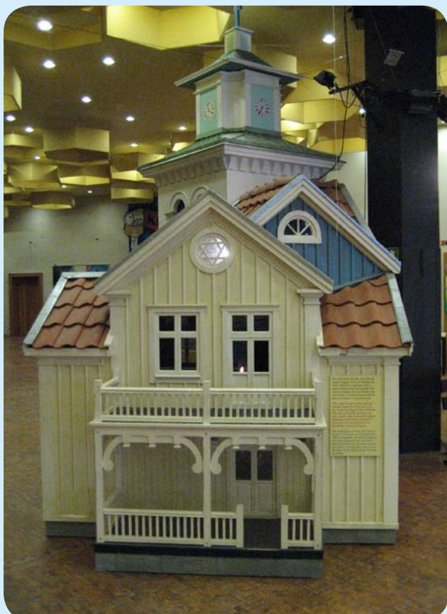
Villan från Prästgårdsgatan finns nu också att beskåda i den tyska huvudstaden. I bakgrunden skimtar Vimmerby kyrka.